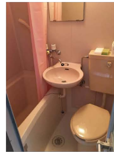
※画像はイメージです。/Hình ảnh chỉ mang tính chất minh họa

T&Y日本語学校は、留学生のための寮を完備しています。料金は毎月20,000円(二人部屋)~50,000円(一人部屋)選択ができます。生活に必要な家具や電気製品はすべて備えてありますので、安心して快適な留学生活を送ることができます。